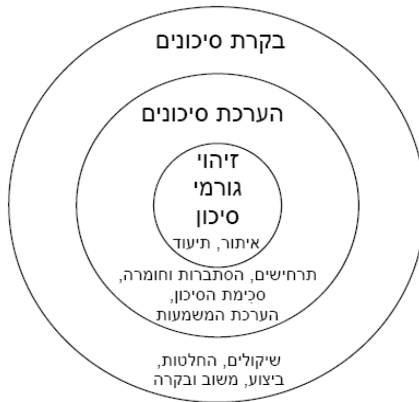
ציור 5 – תהליך ניהול סיכונים