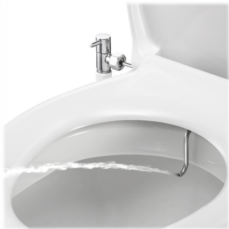
מדגם רשום - 56170