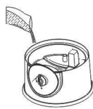
הוספת מלח לימון